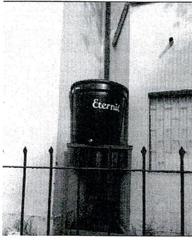
Figura 1. Sistema agua lluvia DGAEP