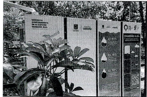
Figura 2. Ekomuro Edificio Bicentenario